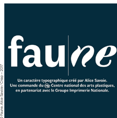
© Faune, Alice Savoie / Cnap - 2017

Le Centre national des arts plastiques (Cnap) a lancé un nouveau caractère typographique inspiré du monde animal, « Faune », en partenariat avec le Groupe Imprimerie nationale. La typographie, conçue par la créatrice Alice Savoie, a été sélectionnée dans le cadre d'un appel aux candidatures du Cnap. L'initiative s'inscrit dans la nouvelle politique d'acquisitions du centre, qui a pour but le soutien de la création de design graphique. 📍