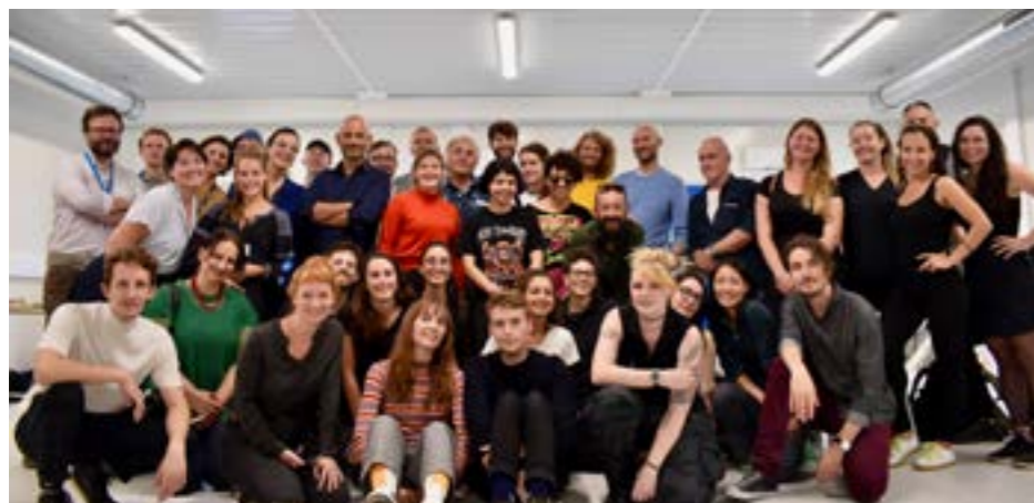
1 e édition Useful Fictions, École polytechnique, 2019

Toutes les réalisations seront présentées les 1 er et 2 juillet 2023 lors d’un week-end d’exposition, de conférences, de visites commentées et d’ateliers.