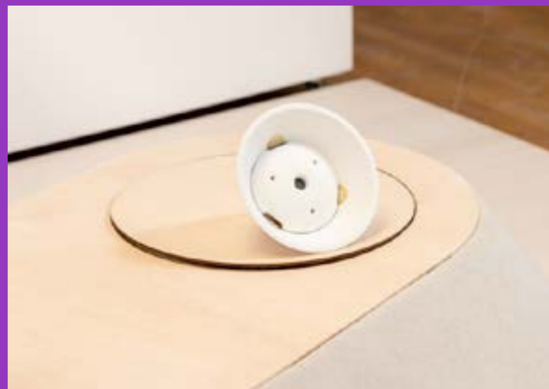
"Curae", Corentin Loubet, 2021

Mots-clés : Design - Objets connectés - Objets à comportements - Machine apprenante - Robotique modulaire