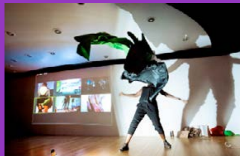
"Imaginary Futures", Marcus Neustetter / Global Periphery, en collaboration avec Annick Bureaud, Paris, 2022

Mots-clés : Performance Multimedia – Fiction écologique – Aléatoire – Processus innovants collaboratifs et hybrides