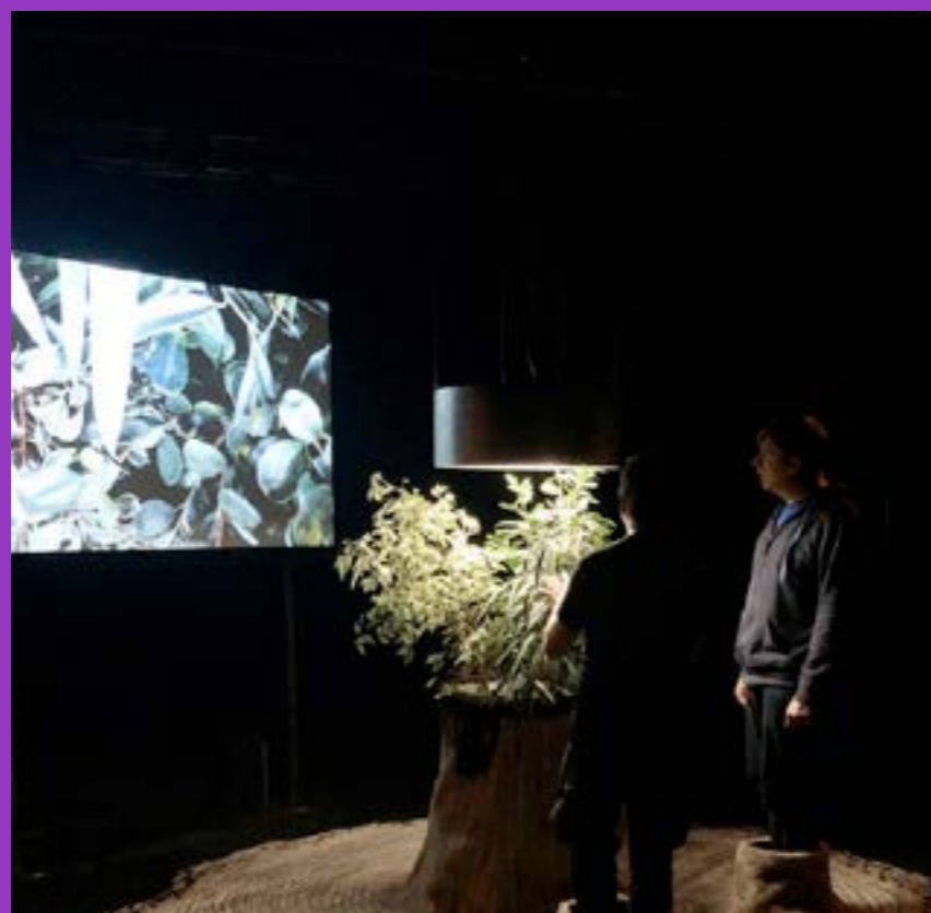
"Langue des bois", Antre Peaux, Bourges. Pièce en collaboration avec Shoï

Mots-clés : Symbiose végétale – Programmation – Tufting – Données de perceptions – Installation participative