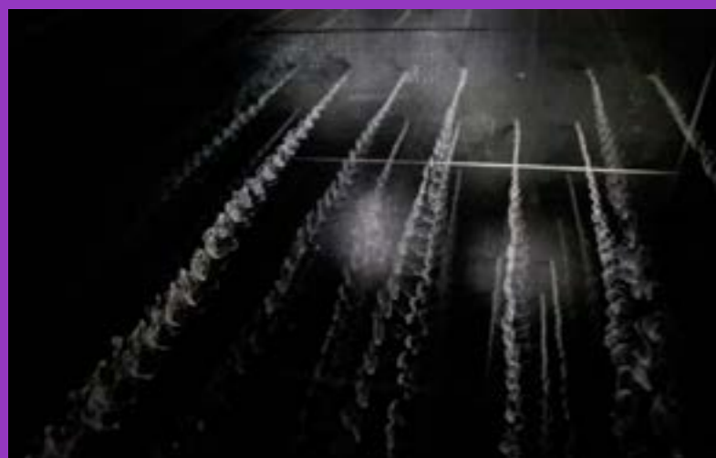
"Mainte page blanche entre ses mains froissée"

Mots-clés : Expérimentations - Do It Yourself - Formes transitoires - Monde flottant - Changement d'état