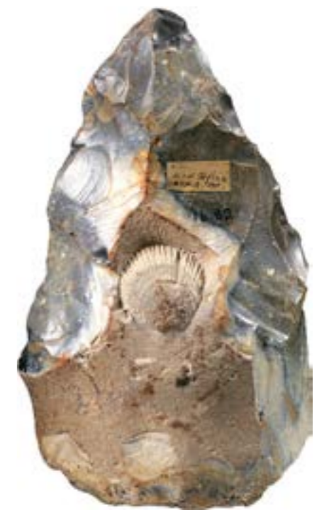
Biface de West Tofts, Norfolk (Royaume-Uni), fin de l'Acheuléen ou Paléolithique moyen, vers 100 000 av. J.-C. Cambridge, Museum of Archaeology and Anthropology

sessions thématiques pour en retracer l'historique, définir son cadre théorique et le statut des connaissances produites, explorer son potentiel d'action et de conscientisation, à la rencontre des savoirs scientifiques, artistiques, technologiques et numériques ainsi que des publics.